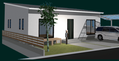
Plan.01 建物面積:76.18㎡(23.04坪) 平屋)LDK19・洋7.7・洋7.5